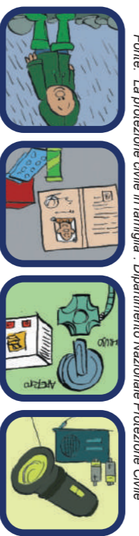
Fonte: "La protezione civile in famiglia", Dipartimento Nazionale Protezione Civile